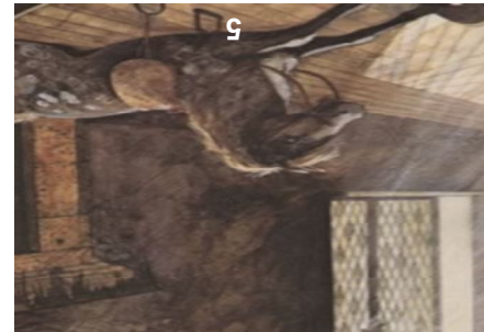
sombre très sombre.