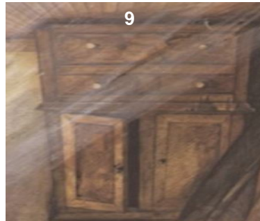
sombre très sombre